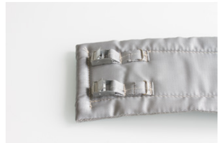
Beispiel 3 / example 3 Spann/Gurtverschluss fastener/belt locking system