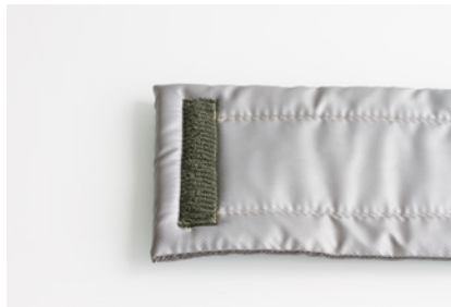
Beispiel 2 / example 2 Klett/Flauschverschluss Velcro/fleece locking system