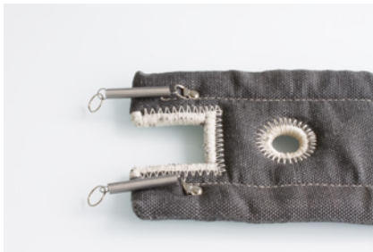
Beispiel 1 / example 1 Feder/Ringverschluss spring/ring locking system