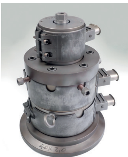
Werkzeug ohne Isolation, vorher tool without insulation, before