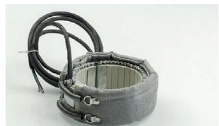
Standardausführungen standard designs