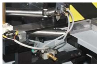
Dispositivo speciale lubrificazione lama Special device for knife lubrication