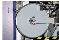
2 pulegge di grandi dimensioni per guidare la lama a nastro 2 big pulley to drive the bandknife