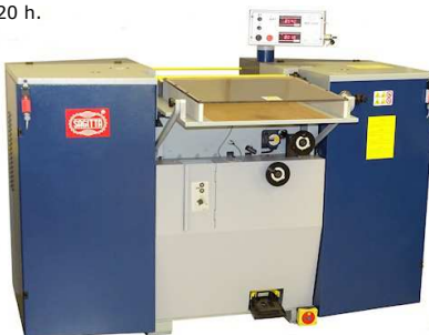
Le caratteristiche tecniche sono indicative e non vincolanti The Technical Data are indicative and not binding